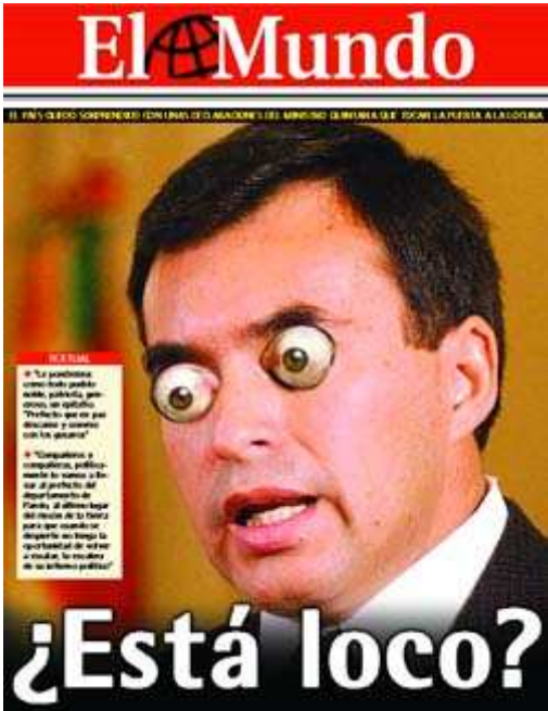
Ique JB on line, Brasil